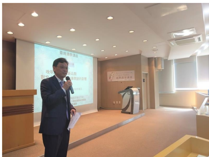
我駐韓唐殿文代表蒞臨會場致詞