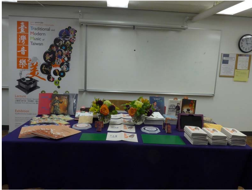
「臺灣音樂之美 (Traditional and Modern Music of Taiwan)」展覽