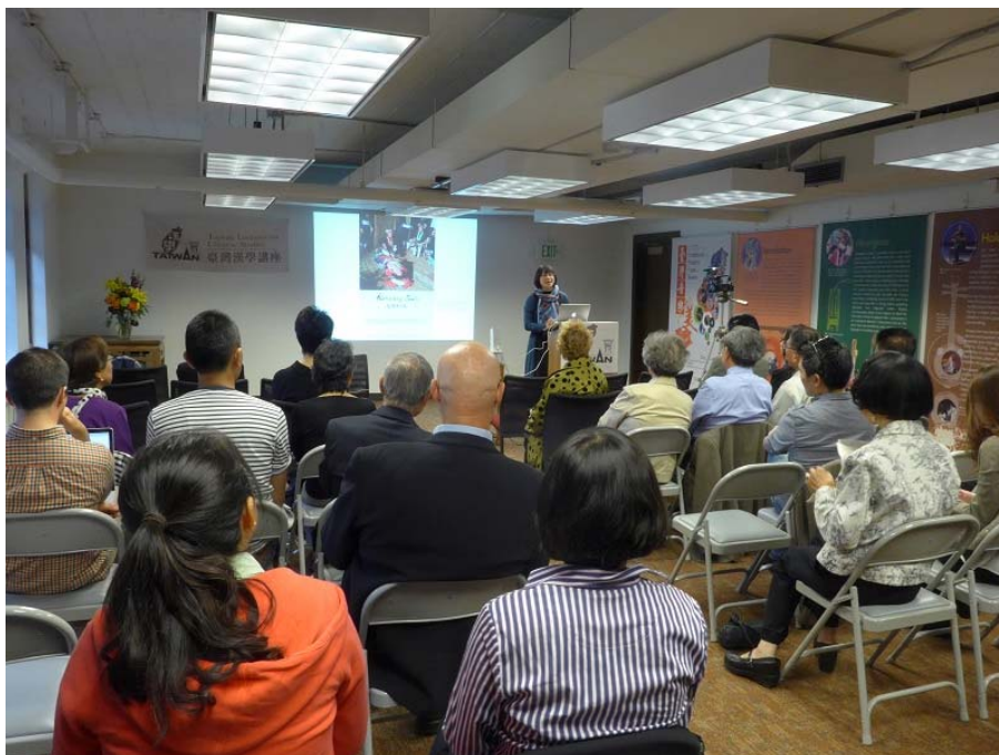
國家圖書館與美國西雅圖華盛頓大學東亞圖書館合作舉辦臺灣漢學講座

配合講座主題，國家圖書館亦於華盛頓大學盛大舉行為期2個月（103年10月2日至12月12日）「臺灣音樂之美(Traditional and Modern Music of Taiwan)」展覽，展出臺灣當代音樂、傳統音樂、流行音樂、原住民族音樂、客家民族音樂及音樂家等類別79冊圖書及92片視聽資料，以宣傳臺灣流行音樂，為臺灣的海外文化交流提升量能。