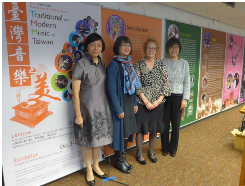
國家圖書館曾館長等人於展覽會場外合影