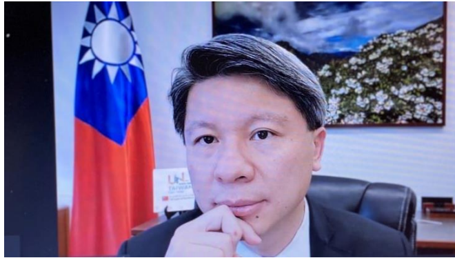
我國駐西雅圖臺北經濟文化辦事處甄國清處長致詞