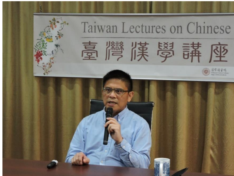
蔡志偉 (Awi Mona) 教授演講