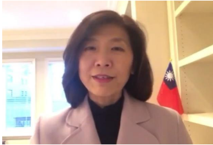
我國駐多倫多臺北經濟文化辦事處徐詠梅處長致詞