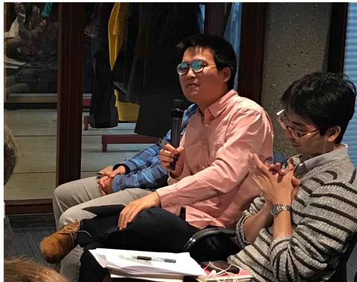
講座觀眾提問交流