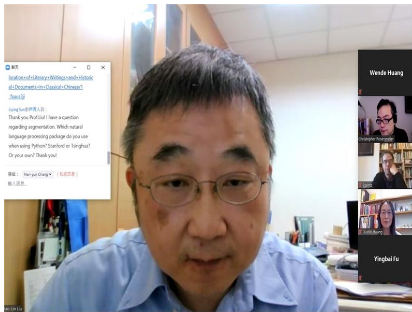
劉昭麟教授線上與其他學者互動