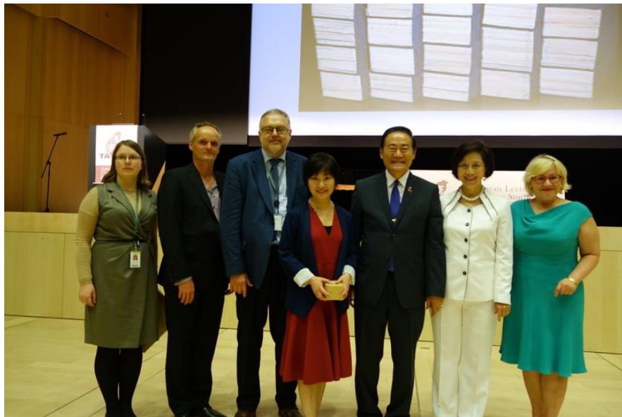
演講後胡曉真教授(中)與拉脫維亞圖書館館長 Andris Vilks (左 3)、 葛光越大使(右 3)等人合影