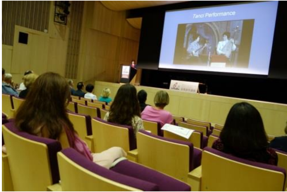
現場聽眾聆聽演講