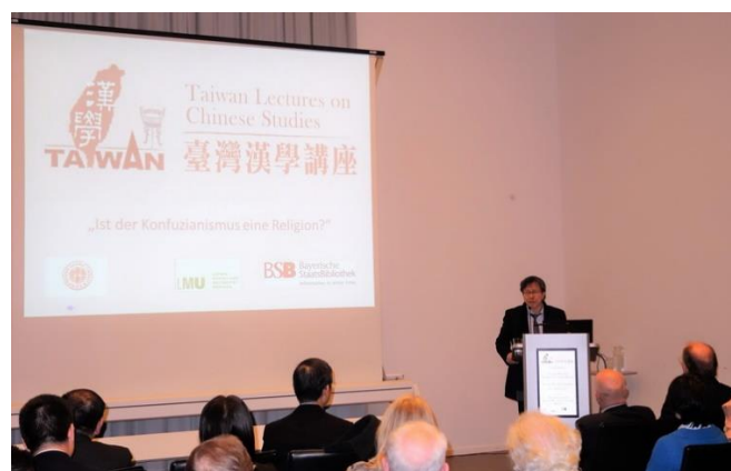
我駐德國代表謝志偉博士致詞