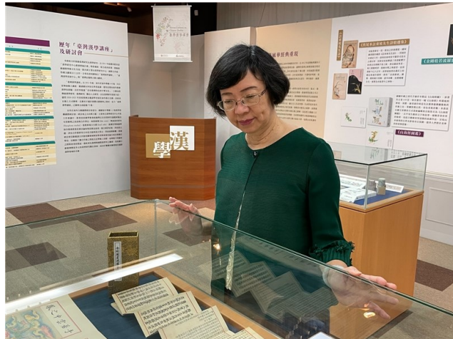
國家圖書館曾館長觀賞特藏文獻主題展

使臺灣漢學研究與推廣成就，光耀於國際社會。國圖真摯純粹的學術交流，除了鞏固了臺灣學術研究與推廣之國際地位，也將是臺灣外交上的重要後盾；期許國圖的漢學研究與耕耘，持續再展鴻圖。