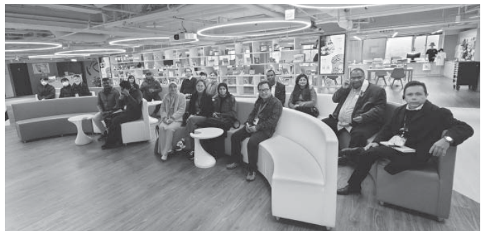
學人於「多媒體創意實驗中心」之共同討論空間大合照