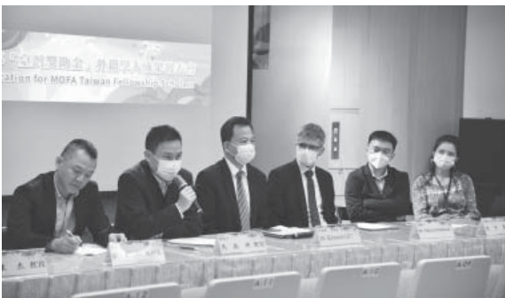
外交部「臺灣獎助金」第三次學人研究成果發表會