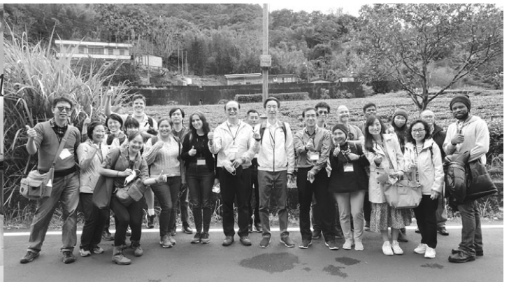
外籍學人茶園參觀合影