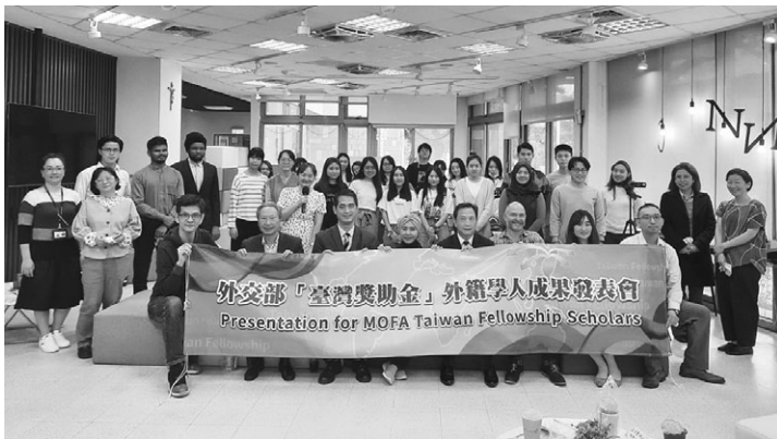
外交部「臺灣獎助金」110 年度第二次學人研究成果發表會合影