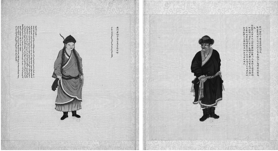
圖二 清佚名《皇清職貢圖》冊頁肅州金塔寺魯古慶等族圖，法國國家圖書館藏（2,26）