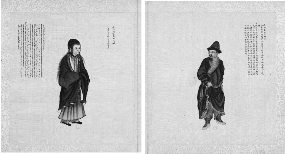
圖一 清佚名《皇清職貢圖》冊頁安西廳哈密圖，法國國家圖書館藏（2,25）

哈密回民，即唐時回紇苗裔，明置哈密衛，嗣服屬於準噶爾。本朝定鼎，回長奉貢襲封。至康熙年間西路用兵，為設駐防武臣，屹為重鎮。其人男戴紅頂黑簷帽，衣長領齊袖衣。婦人披髮四垂，戴瓜皮小帽，衣用各色褐布，飲食風俗俱同內地回民，歲貢哈密瓜等物。其瓜州五堡回民，則係雍正年間投誠安插者，服飾與哈密同。