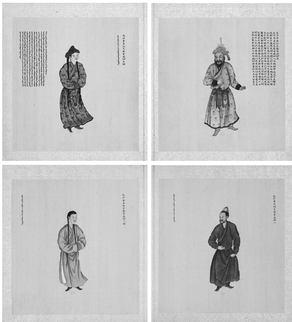
圖三 清佚名《皇清職貢圖》冊頁烏什、庫車、阿克蘇等城圖，法國國家圖書館藏 (2,19/2,20)

另有「烏什、庫車、阿克蘇等處徇人」、「烏什、庫車、阿克蘇等處徇人婦」一組，無圖說。