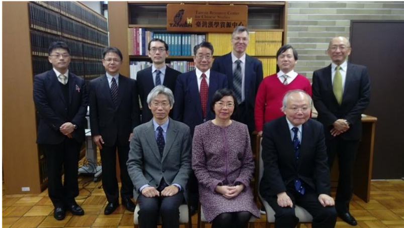
京都大學 TRCCS 揭幕啟用