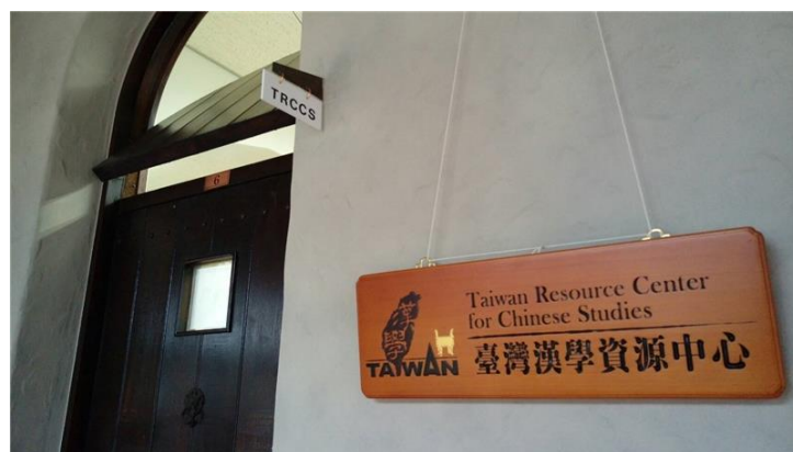
國圖於京都大學設立臺灣漢學資源中心

簽約儀式與開幕典禮完成之後，「人文科學研究所東亞人文情報學研究中心」特別安排人文科學研究所圖書館與京都大學附屬圖書館參訪，先進的圖書儲藏設備與完善的古籍掃描設施令人印象深刻，也呼應其珍貴的館藏內容。