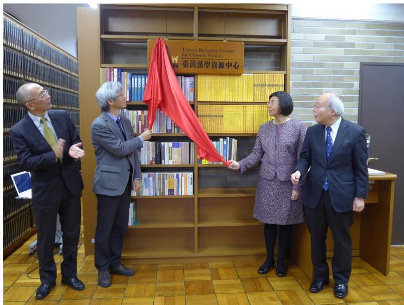
京都大學 TRCCS 揭牌