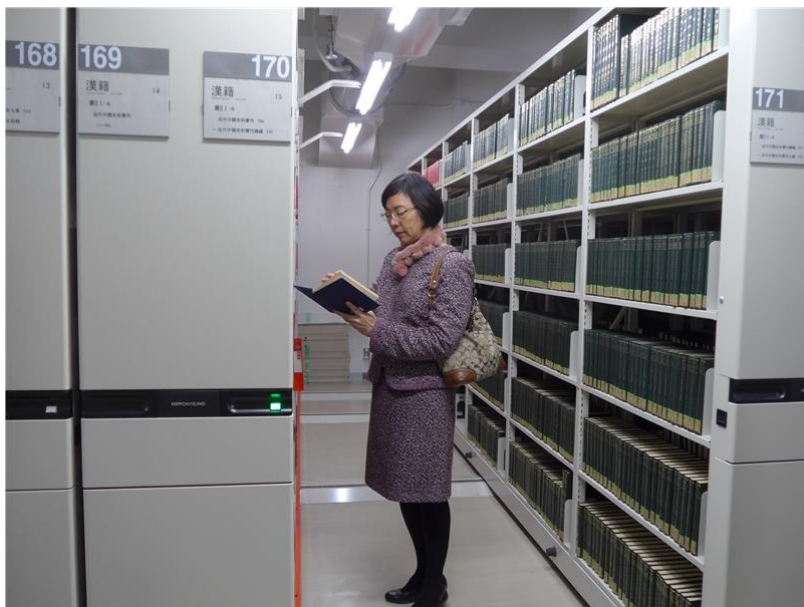
參訪人文科學研究所圖書館