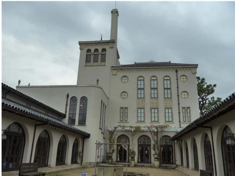
京都大學「人文科學研究所東亞人文情報學研究中心」