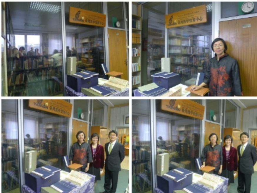
捷克科學院臺灣漢學研究資源中心圓滿成功