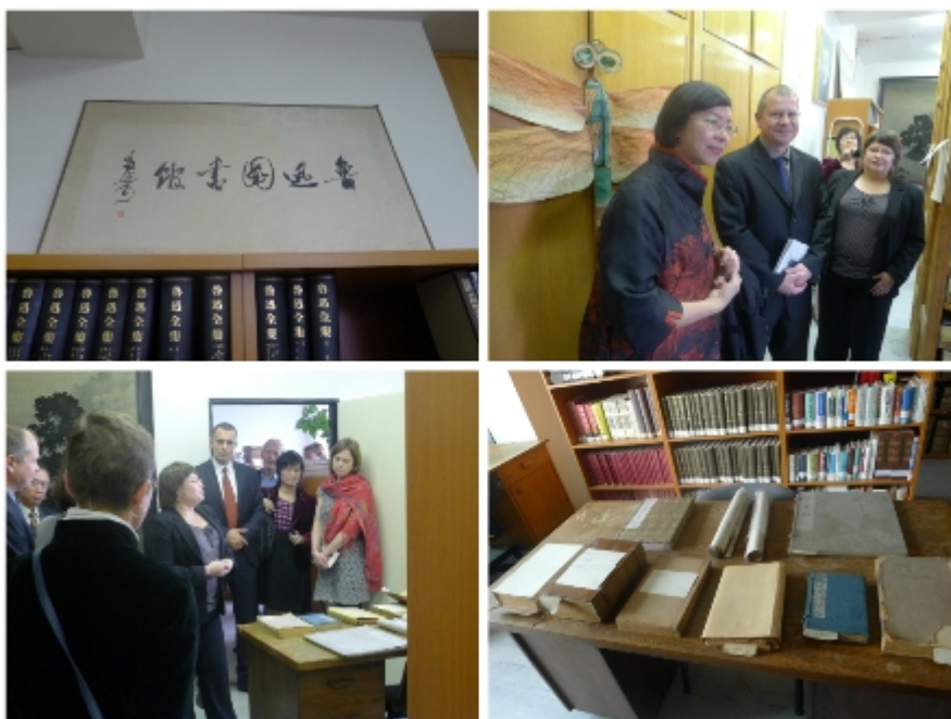
參觀捷克科學院東方研究所的魯迅圖書館