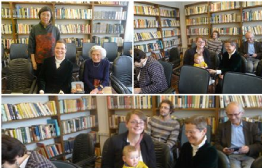
曾館長與漢學家及學人寒暄