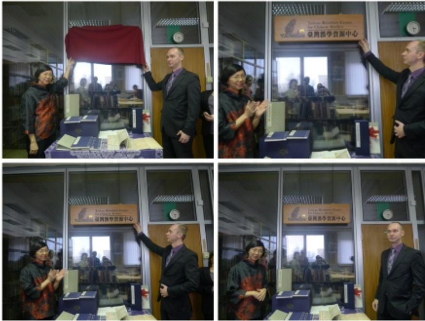
捷克科學院亞非研究所臺灣漢學研究中心啟用揭牌