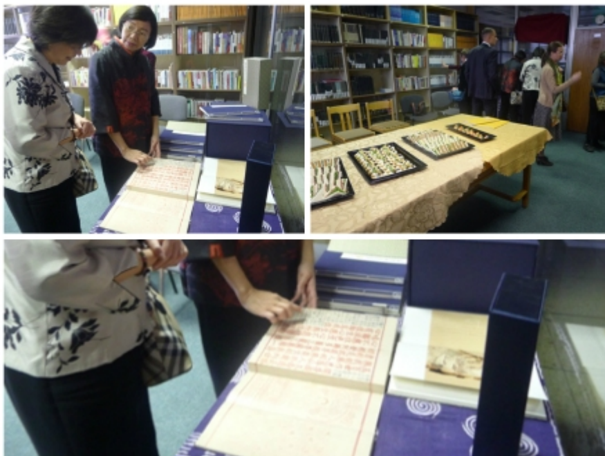
曾館長為薛代表介紹贈書註東坡先生詩