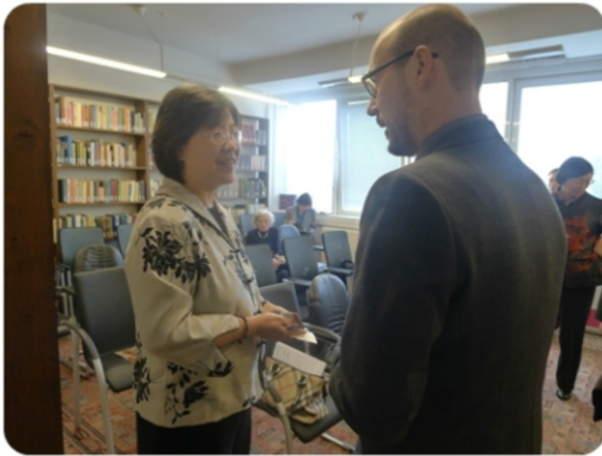
薛代表與漢學家寒暄