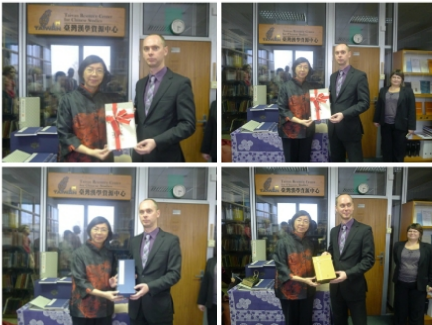
國圖贈送國寶級古籍復刻書《註東坡先生詩》及佛學經典《金剛般若波羅蜜經》