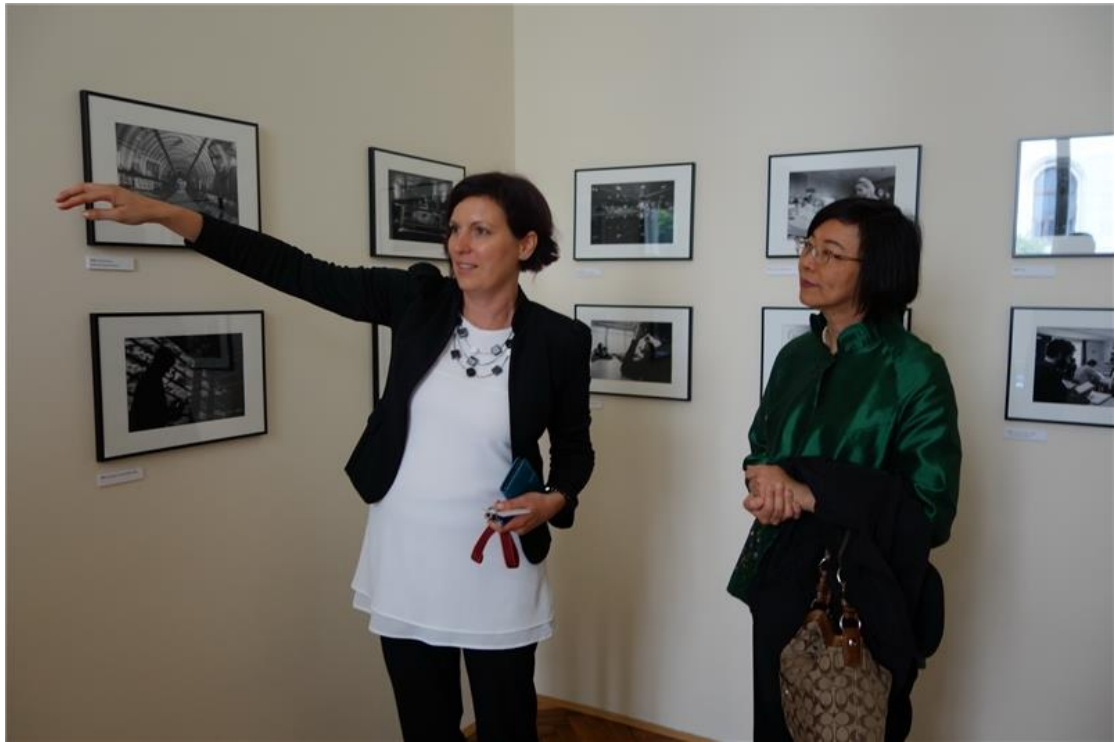
盧比亞納大學請專人為曾館長導覽校史