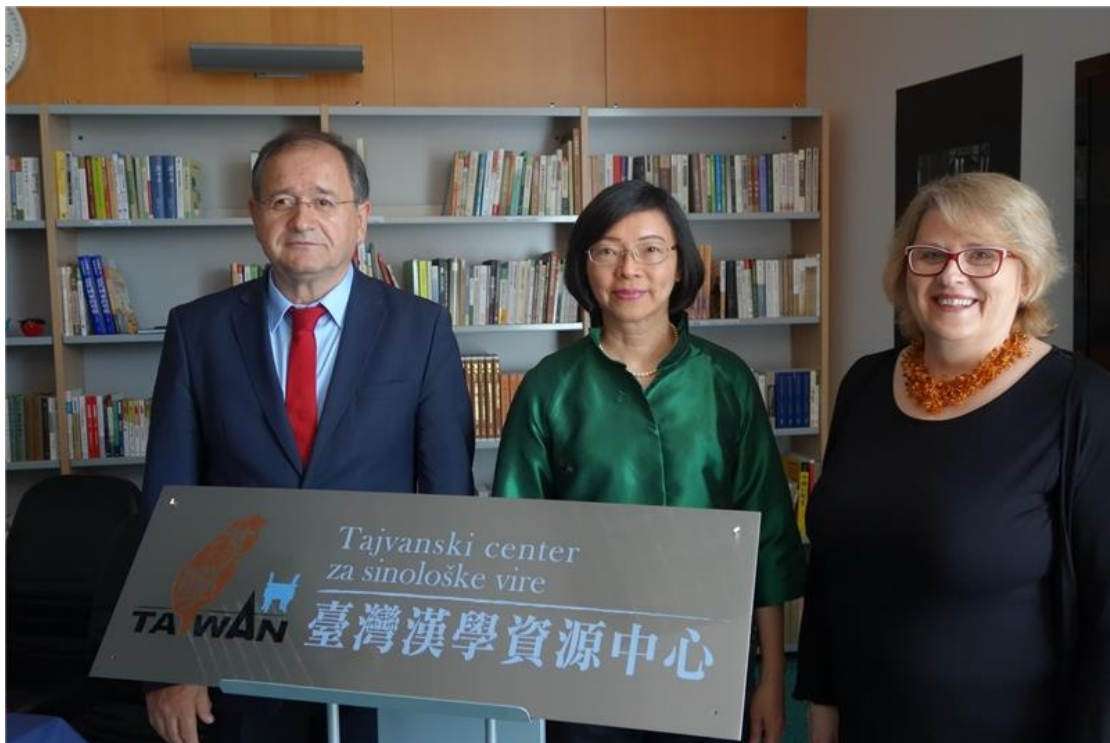
斯洛維尼亞盧比亞納大學「臺灣漢學資源中心」揭牌啟用