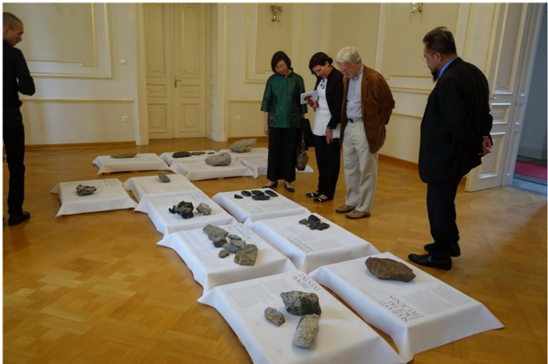
盧比亞納大學展示陳列歷史化石