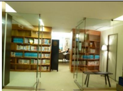
紐約漢學書房藏書區入口