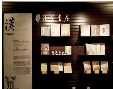
紐約漢學書房視覺主題牆面

民國 100 年 10 月，紐約臺灣書院漢學書房於紐約臺北經濟文化中心五樓設立，緊鄰第五大道及紐約公共圖書館的精華地帶。其入口以大面主題牆迎賓，深褐色牆面上展示不同書籍，大廳裡的原木桌椅與溫暖色調與紐文中心一、二樓展示的董陽孜書法相互輝映。簡約凝鍊的線條，瀟灑漢學氣氛，呈現舒適優雅的閱讀環境。漢學書房分藏書區與閱讀區兩區域，藏書區為玻璃門後的空間，藏有近十年臺灣出版的臺灣研究及漢學研究優良圖書，包含藝術、歷史地理、語言文學、哲學思想、宗教、政治社會等六大領域約 700 餘冊，以及影音光碟、數位典藏等。漢學書房以不同顏色的標籤分類藏書，書籍資料每年更新補充，另外，書房提供圖書目錄 ( http://ccs.ncl.edu.tw/academy1.aspx ) 供使用者查詢；書架旁的閱讀區則讓讀者在繁忙的曼哈頓市區中擁有一個充滿藝術氣息的靜謐閱讀空間。開放時間為週二、週四（放假日除外） 10:00—16:00。