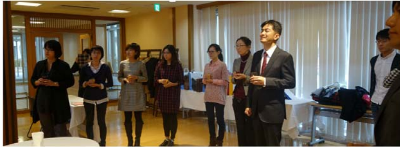
古田館長歡迎貴賓享用茶點