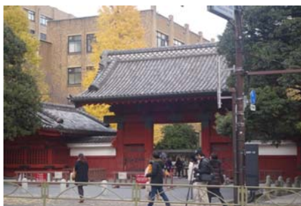
駒場圖書館古色古香的大門