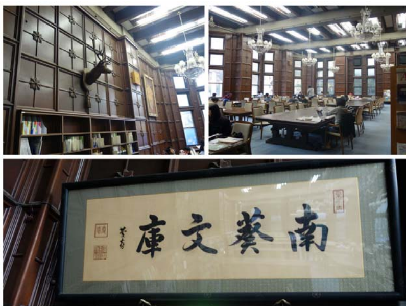
參觀東京大學圖書館總圖