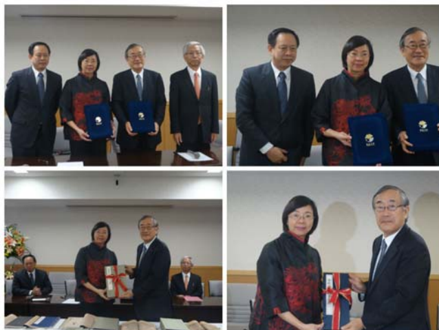
曾館長在開幕典禮上特別贈送國寶級古籍復刻書《註東坡先生詩》予日本東京大學圖書館，以豐富該館的館藏。