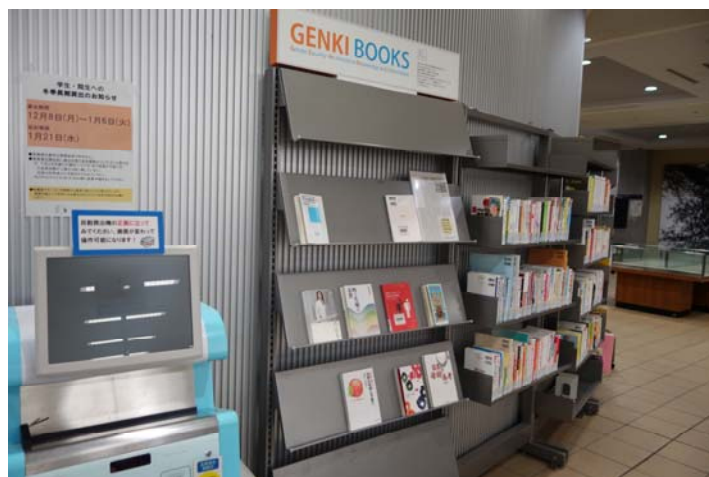
2010 年新設的元氣圖書區(Genki Books)，提供性別關係相關書籍供讀者借閱。