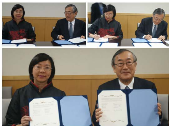
曾館長與東京大學圖書館總館長古田元夫簽約