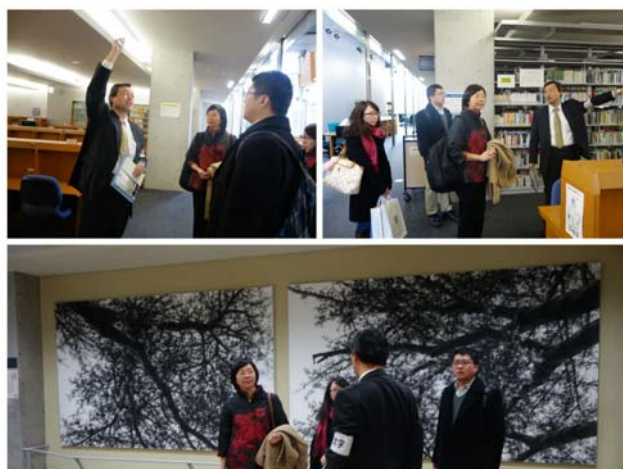
駒場圖書館熱情為來賓導覽