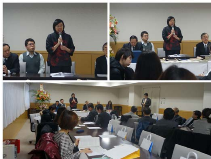
曾館長以日文及中文致詞獲得全場熱烈掌聲