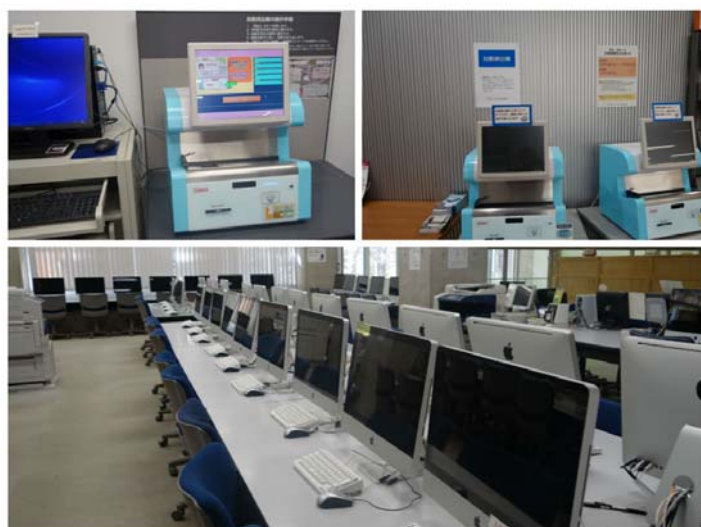
駒場圖書館自動借書機及提供讀者使用的蘋果電腦