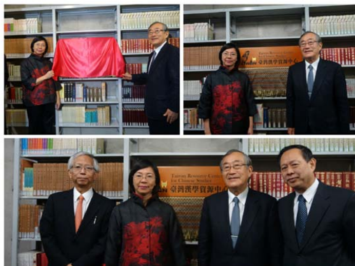
設立於日本東京大學圖書館的「臺灣漢學資源中心」正式揭幕啟用